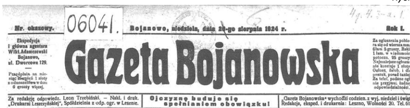
Ryc. 3 i 4.

Co prawda nie udało mi się dotychczas „zdobyć” oryginalnych tytułów prasowych wydawanych w Bojanowie, a jedynie kopie nielicznych numerów znajdujących się w polskich i niemieckich bibliotekach. Przedstawiam jedynie skany tych winiet.