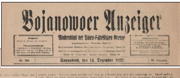
Ryc. 5 i 6. Pieczęćka drukarni na marginesie „Bojanowoer Anzeiger”.