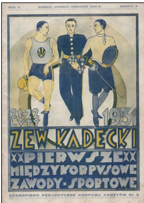
Ryc. 11. „Zew Kadecki” z 1931 r.

Kopalnią grafik dla autorów ekspozycji w klasie filatelistyki otwartej może być wydawane w latach 1834-49 w Lesznie czasopismo „Przyjacieli Ludu czyli Tygodnik potrzebnych i pożytecznych wiadomości” (Ryc. 12 i 13). Był to pierwszy ilustrowany magazyn w Polsce [7].